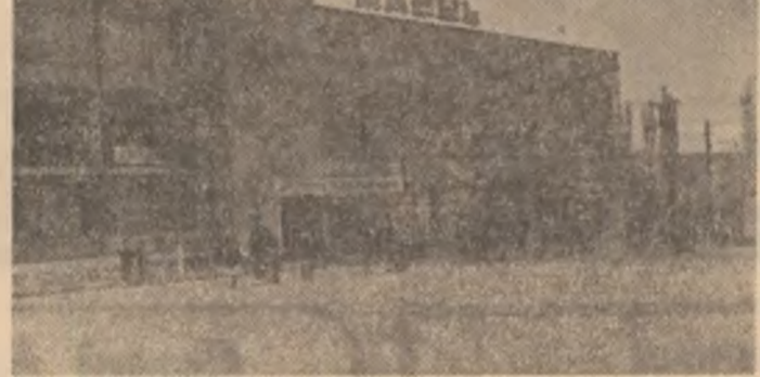
Noul complex comercial, dat recent in folosinta, in orasul Rosiori de Veda.