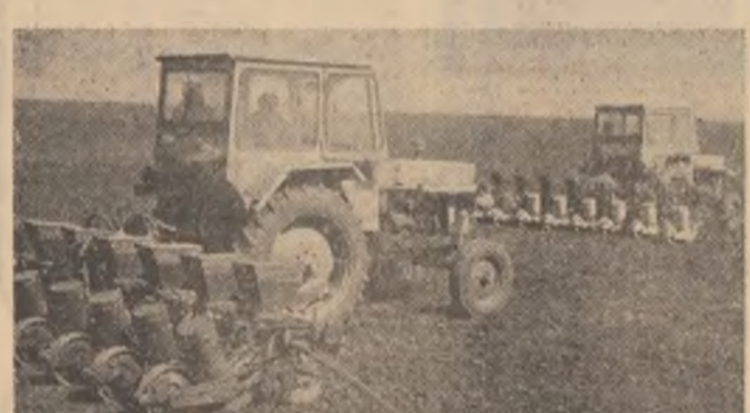
Semănatul porumbului la Ploșca unde...