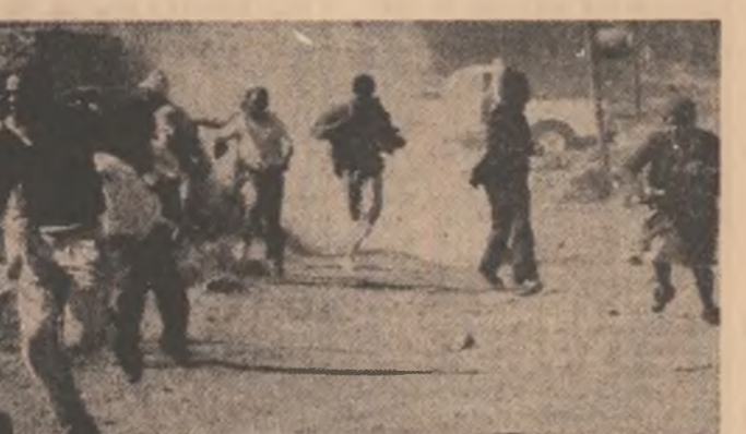
Posturile de radio colonizatoare nu sînt singura cale folosită de războiul ideologic împotriva