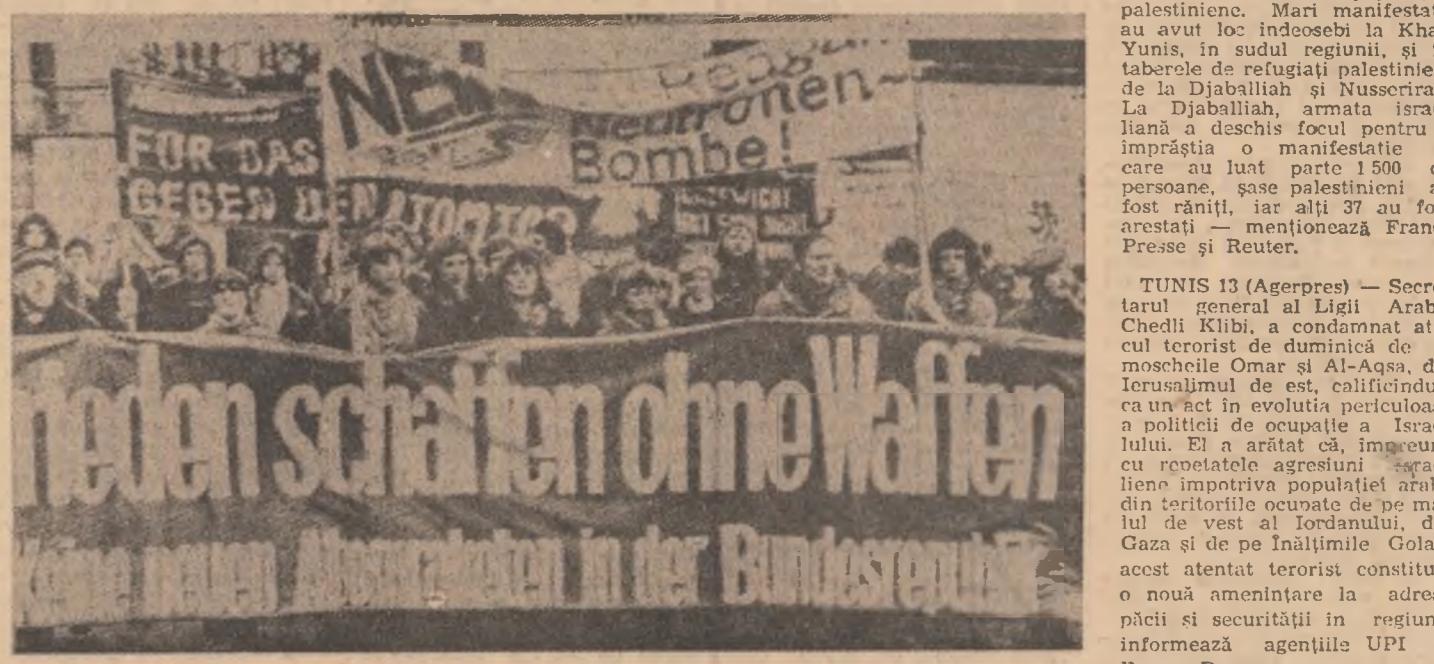
„Măștile” de protest împotriva cursei înarmărilor

Circa 200 noi produse au fost, anul acesta, ameliorate în sensul reducerii consumului energetic, întrucît sectorul de echipament electric și mecanic consumă circa 50 la sută din cărbune, 60 la sută din petrol electric și peste 90 la sută din petrolul folosit de această provincie.