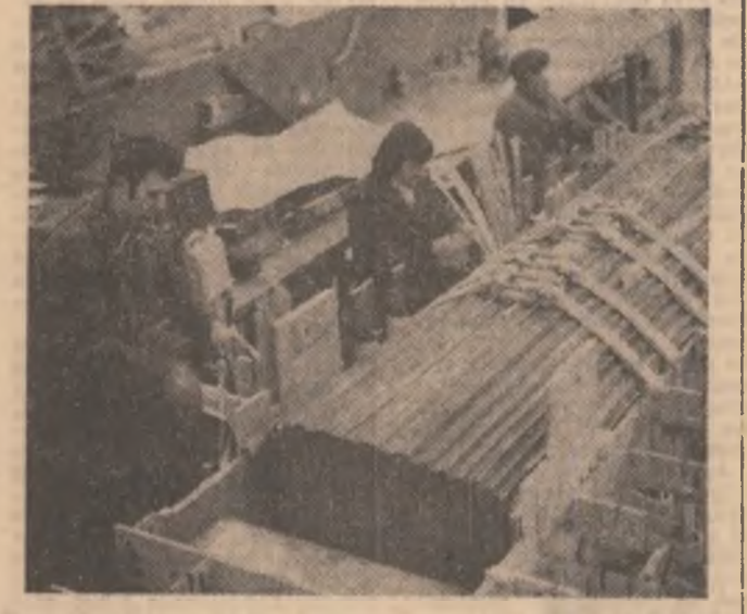
Imagine de la Fabrica de transformare a întreprinderii „Electrominis” Craiova

În aceeași atmosferă de caldă prietenie, de stimă și înțelegere reciprocă, ieri a continuat