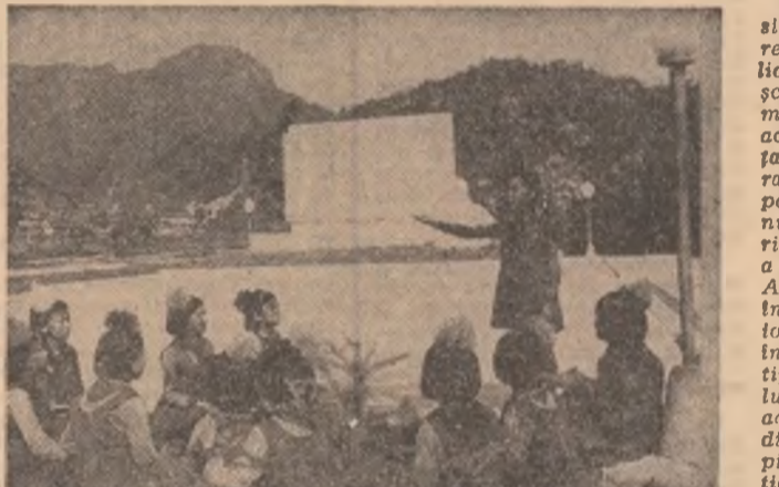
Insemnări din R. P. D. Coreeană