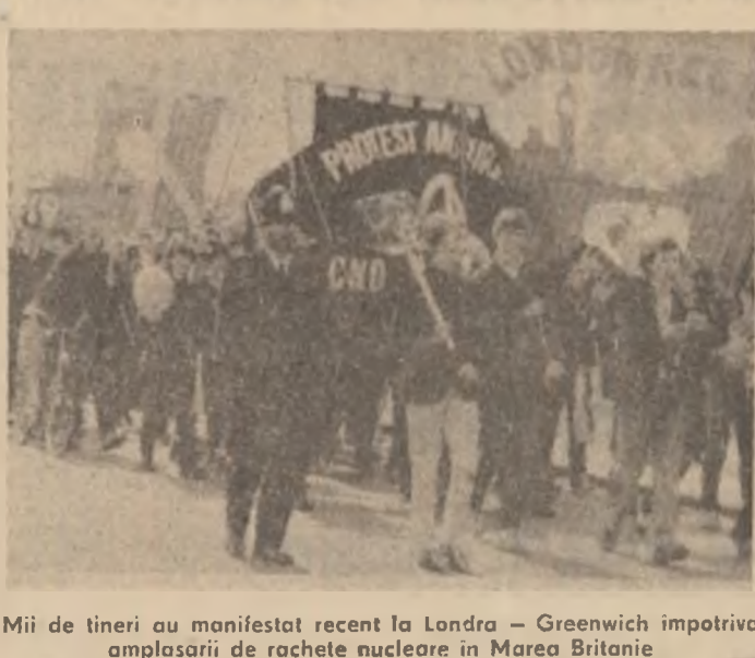
Mii de tineri au manifestat recent la Londra - Greenich împotriva amplasării de rachete nucleare în Marea Britanie