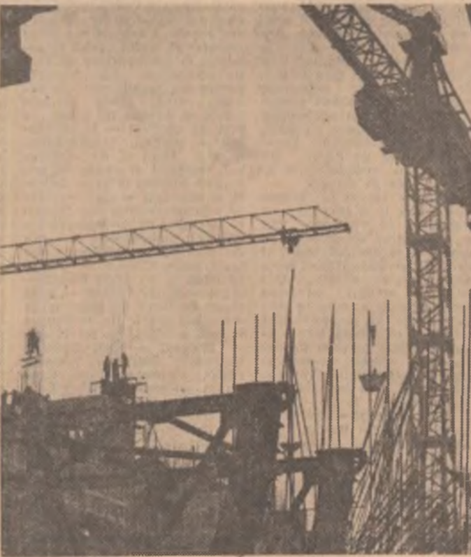
Șantierul național al tineretului de la Motru

adoptate, prin efortul tuturor brigadierilor am reușit să încheiem cu o lună mai devreme activitatea de pregătire a fronturilor de lucru și a drumurilor de acces de la cele trei cartiere noi - Rovinari, Păian și P.S.D. și celele organizații muncitorești erau, totodată, un prilej de impunere a revindicărilor concrete specifice fiecărui etapă. Astfel, în anii crizei economice, demonstrațiile de 1 Mai se constituiau ca parte