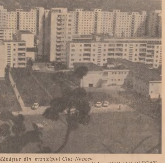
Cartierul Mănăștur din municipiul Cluj-Napoca