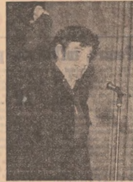
Sosit în fiecare zi direct de la aeroport, Ion Caramitru a reușit nu numai să prîndă toate spectacolele de la Cluj-Napoca, dar să ne și ofere, în ciuda oboselii care-l marca după orele de repetații de la „Bulandra”, o adevărată probă de virtuozitate actoricească