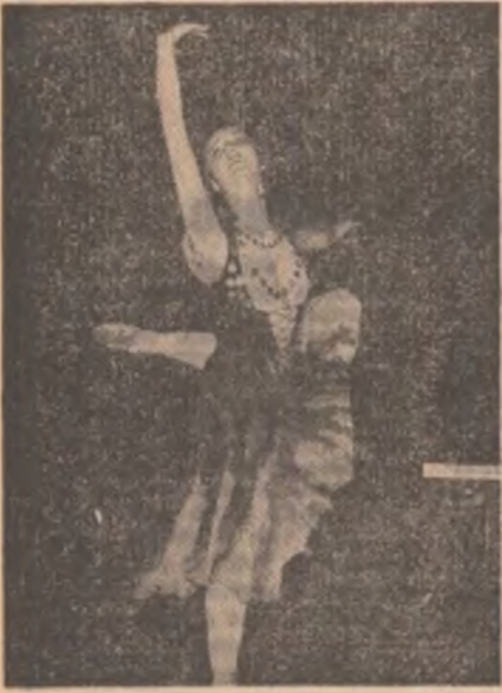
Esmeralda din Cocosul de la Notre Dame, alias Carmen Angheluş într-unul dintre cele mai aplaudate momente ale spectacolului: baletul clasic

Pagină realizată de LAURENȚIU OLAN