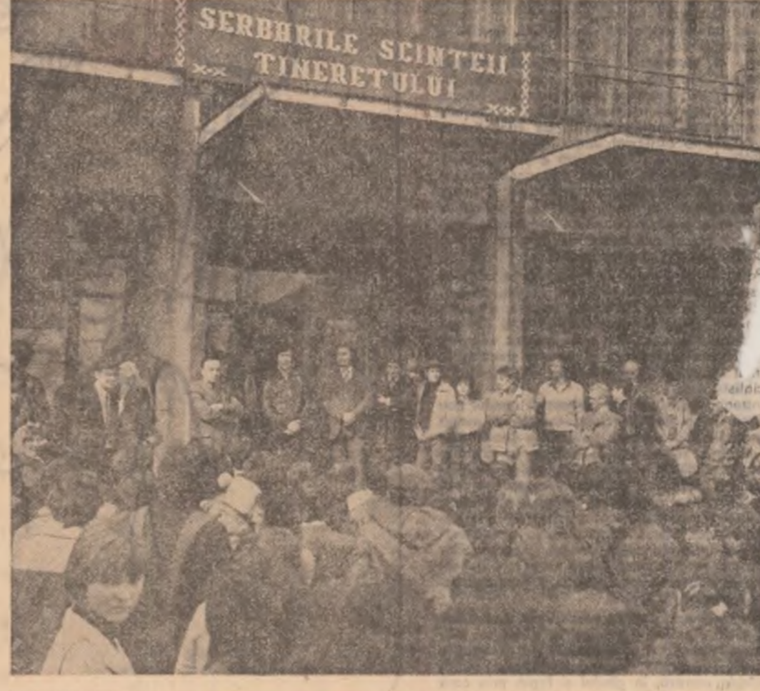
La Blaj, în apropiere de Cimpia Libertății, Serbările au început în aer liber. Obligați de o întrerupere de curent care a afectat întreg orașul ne depășim ora de începere a primului spectacol, membrii Serbărilor au ieșit în fața Casei orașenești de cultură purtînd un interesant dialog cu sutele de tineri prezenți aici

Cu această nouă ediție a lor, Serbările Șcinței tineretului și-au cîștigat cel puțin încă zece mii de prieteni tineri. Tineri care, în zilele de întrecere, premergătoare marii sărbători a muncii, și Zilei tineretului s-au întrecut pe ei înșiși și prin modul în care au contribuit la realizarea Serbărilor zărilor noastre.