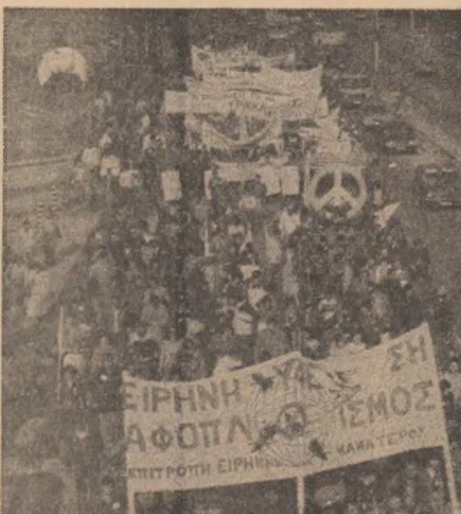
Aspect de la marșul păcii desfășurat în Grecia între Elefsina și Atena

rii R.F.G., Helmut Schmidt, un mesaj în care se arată că „securitatea noastră poate fi asigurată nu pe calea unor noi tipuri de arme mai periculoase, ci numai pe calea dezarmării și destinderii” — relatează agenția T.A.S.S. Vom continua lupta