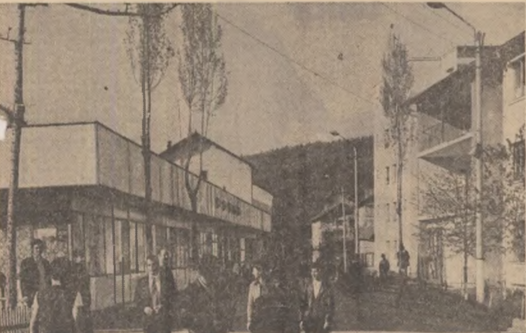
Ostrov — un oraș minier în plină dezvoltare

numite acțiuni organizate la nivel județean s-au permanentizat, cîstîgînd și o meritată notorietate națională. Este vorba de „Festivalul de creație și interpretare teatrală Sălciuc — Moldova”, „Festivalul Enescu — Orfeu moldav”, „Festivalul-concurs „Retorta de cristal”, „Salonul băcăuan al cântării”, „Festivalul concurs