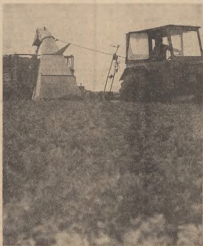
unele unități agricole din județele Mureș și Caraș-Severin, zone de tradiție în creșterea animalelor.

Importanța economică a sectorului zootehnic în ansamblul agriculturii nu mai trebuie argumentată. Cu toate acestea, în domeniul creșterii animalelor se înregistrează numeroase deficiențe, fapt care afectează atât veniturile unităților agricole, cît și realizarea planului la producția animalieră. De ce? Mai întîi că, deși zootehnia este un sector de activitate continuă, volumul de muncă este mai fluctuant decît la cultura porumbului, să zicem — cea mai serioasă alertă creînd o achiziționarea furajelor și nu — așa cum ar fi normal — producerea furajelor. Pentru aceasta toate unitățile dispun de baza necesară, dar — desigur — este mult mai comod să cumperi! Aooi, insulozarea! Acum, cînd recoltarea furajelor cultivate este din ce în ce mai intensă, ele trebuie insulozate și nu date spre consum. Animalele trebuie scoase la pășune, ceea ce pe alocuri s-a cam uitat. Apoi, toate resursele vegetale trebuie adunate cu grijă și depozitate, precupcare care, de asemenea, a cam dispărut din practica unor gospodarari. Zootehnia are nevoie de furaje, de combustibil biologic deci, pentru a produce carne, lapte, lînă. Iar furajele se string de pe acum pentru la iarnă. Acum, cînd animalele au nevoie de pășunatul sănătos în aer liber. Să urmărim cîteva preocupări în acest sens în