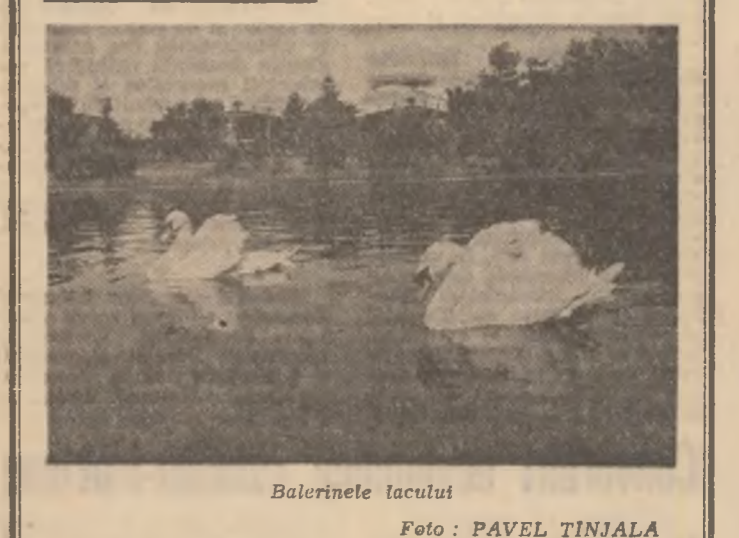
Balinetele lacului