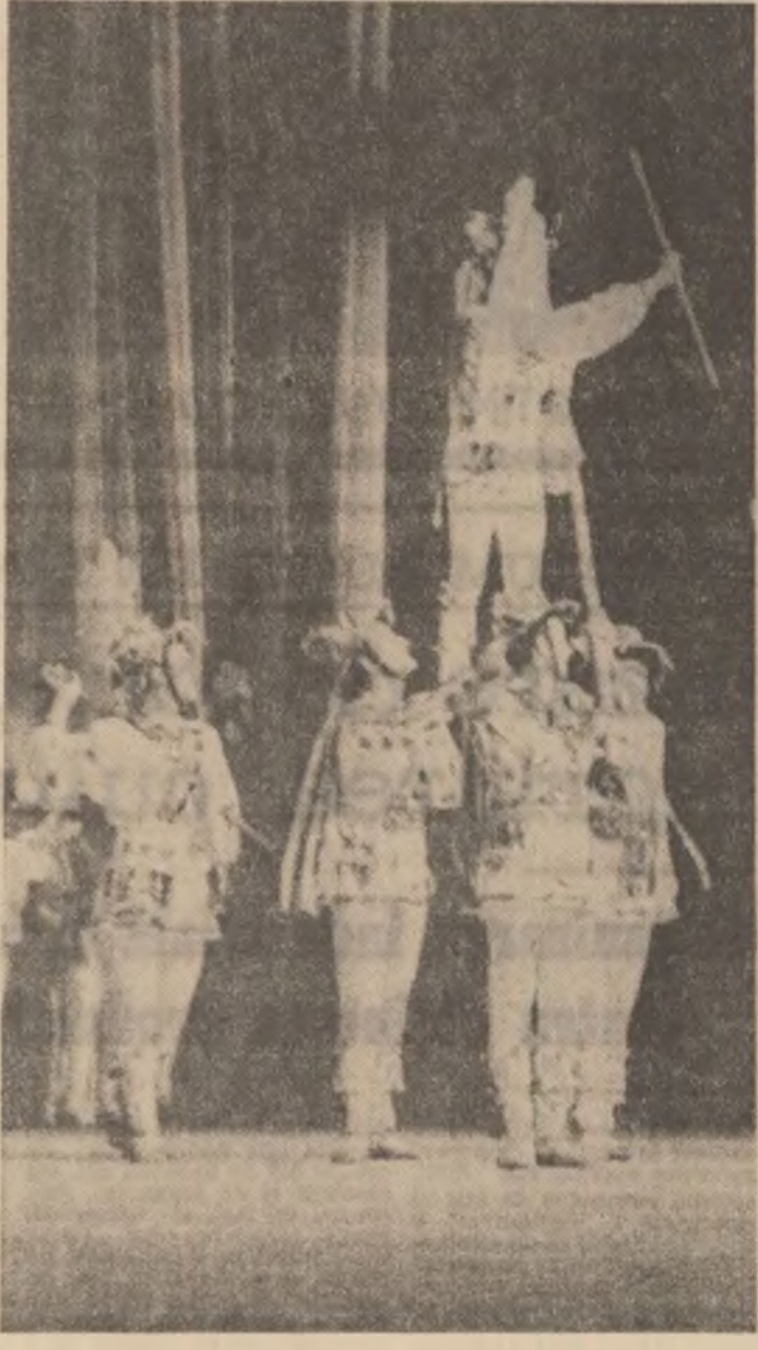
Vigoare, grație, armonie, totul într-o demonstrație de virtuozitate și devotament față de valorile folclorului nostru