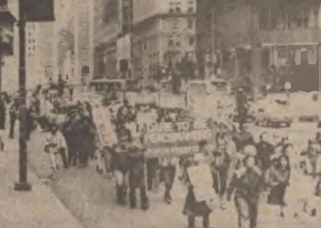
S.U.A.: Aspect din timpul demonstrației care a avut loc recent în orașul Chicago împotriva cursei inarmărilor nucleare

Au fost reievate bunele raporturi de prietenie și colaborare