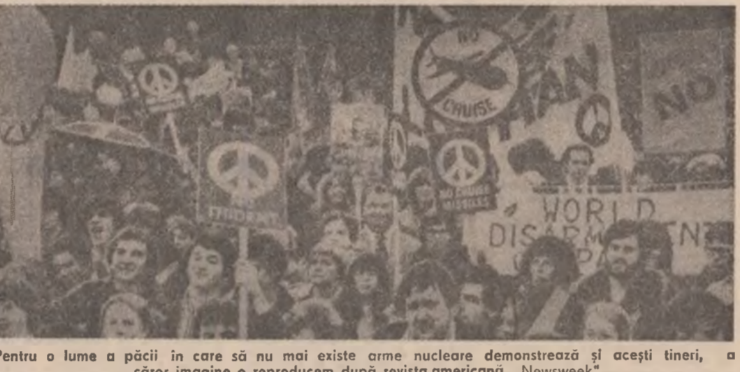
Pentru o lume a păcii în care să nu mai existe arme nucleare demonstrează și acești tineri, a căror imagine o reproducem după revista americană „Newsweek”

LONDRA 21 (Agerpres). — Ministerul Apărării al Marii Britanii a confirmat că un elicopter britanic de tip „Sea King” s-a prăbușit în sudul statului Chile, în timpul efectuării unei misiuni de recunoaștere în regiunea argentiniană Tara de Foc, relatează agenția France Presse.