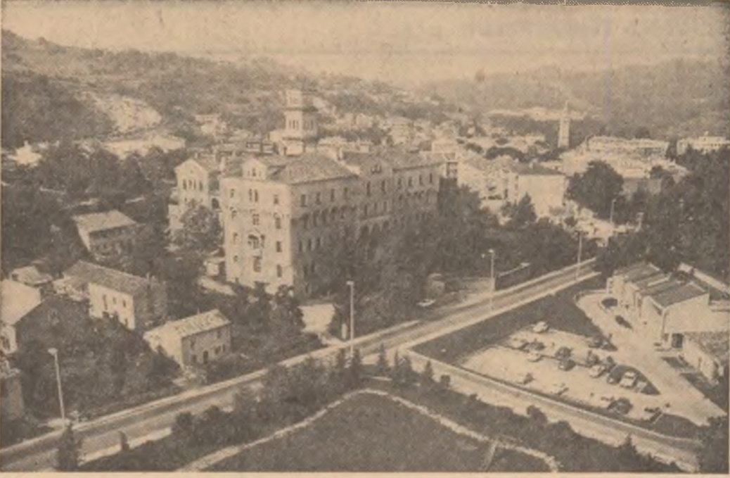
R.S.F. IUGOSLAVIA — Imagine de ansamblu a pitorescului orașel Pazin