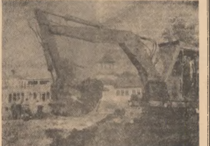
La Complexul muzeistic „Stela” din Tirgoviște s-a deschis un șantier pentru refacerea și protejarea monumentelor sale, ce au o deosebită importanță istorică și turistică. Prin acțiuni de muncă patriotică, la care își aduc contribuția elevii, tinerii din unitățile economice ale municipiului Tirgoviște, se refac clădiri de locuit, care au existat în secolele XV-XVII. Cu acest prilej s-a scos la iveală și un tezaur de monede din secolul al XVI-lea.