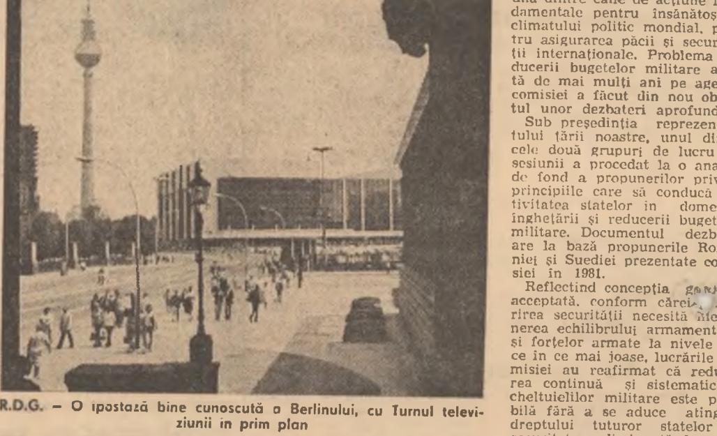
R.D.G. — O ipostază bine cunoscută o Berlinului, cu Turnul televiziunii în prim plan

Inundații puternice, datorate ploilor torențiale de dimensiuni record, au afectat mai multe regiuni din Nicaragua, în special din nord-vest, unde se semnalează și mari alunecări de teren, relatează agențiile internaționale de presă. După cum se știe, în această țară, domesticirea elefanților sălbatici și folosirea lor la diferite acțiuni sau ca „mijloc de transport” este o industrie străveche, pe care în prezent autoritățile vor să stimuleze și, totodată, să prevină vinarsa excesivă a lor în regiunile unde trăiesc în libertate, relatează agenția de presă Lankapuvu.