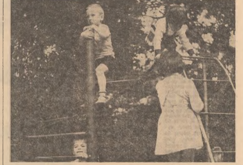
Pagină realizată de: MIOARA VERGU, EUGEN MIHAESCU, GABRIEL NĂSTASE, CONSTANTIN STAN

este un lucru grav în care pot interveni doar oamenii mari adunați toți la un loc. Noi le propunem oamenilor mari să invite de la noi jocul de-a viața, de-a fericierea. Haideți să ne jucăm cu toții „De-a viața”!