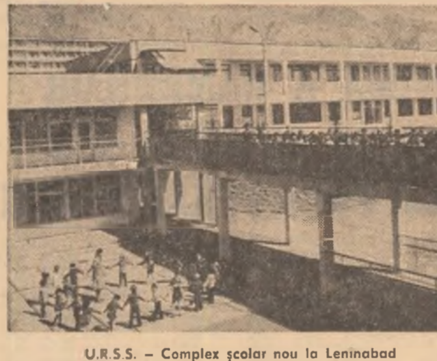
U.R.S.S. — Complex școlar nou la Leninabad

La 16 iunie, la Geneva au început convorbirile afgano-pakistaneze prin mijlocurile reprezentanților personal al secretarului general al O.N.U., Diego Cordovez, relatează agenția T.A.S.S. Delegația afgană la convorbiri este condusă de ministrul de externe Șah Mohamad Dost, iar cea pakistaneză de ministrul de externe Sahibzad Yacoob Ali Khan.