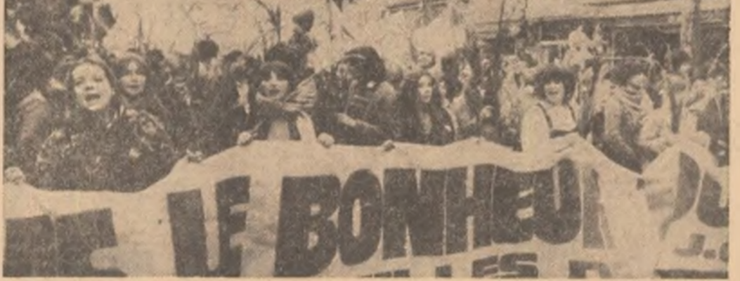
In numele vieții, pentru dezarmare și pace, numeroși tineri au demonstrat recent la Paris