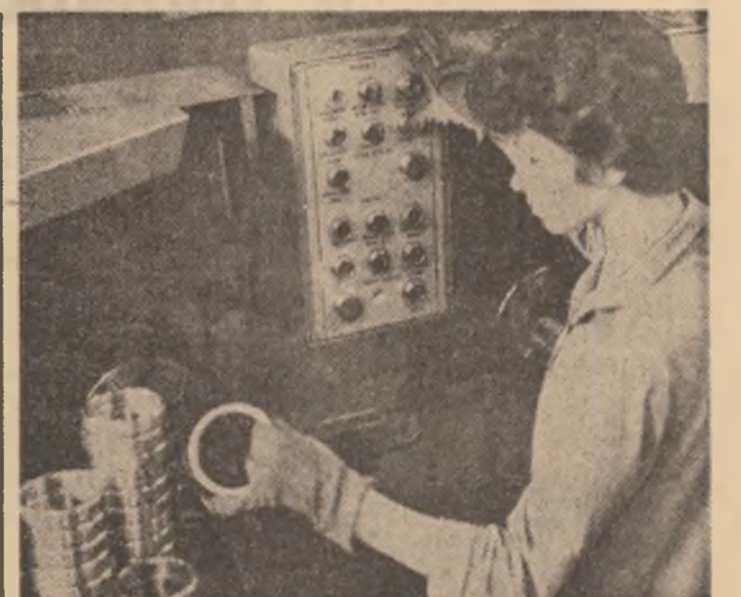
Întreprinderea de ruimenți — Birlad