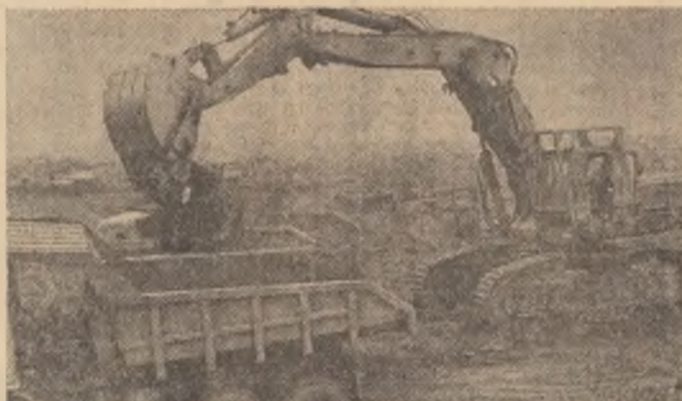
Dacă în 1965 se fabricau câteva sute de excavatoare, rulouri compresoare și alte utilaje pentru activitate de construcții, astăzi, se produc anual câteva mii de astfel de utilaje. Concomitent s-a dezvoltat corespunzător și producția de materiale de construcții, doar în acest an urmînd să se fabrică de 3 ori mai mult ciment ca în 1965.