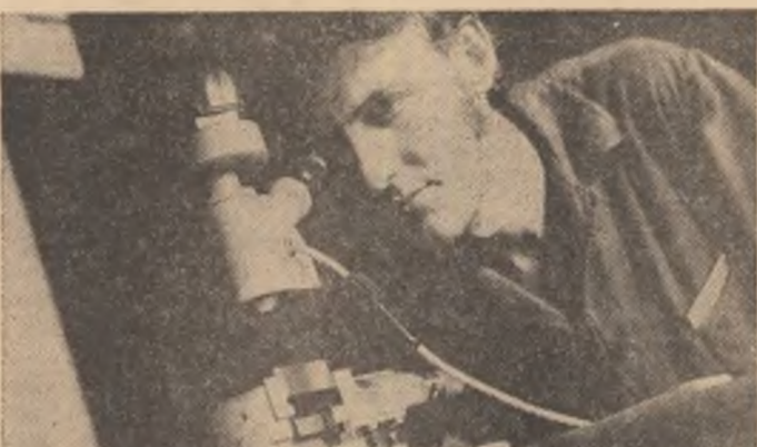
Puternica dezvoltare industrială a dus la creșterea substanțială a numărului de noi locuri de muncă, îndeosebi în industrie și în ramurile negriștice acestea fiind în principal destinate tinerilor. Semnificativ este faptul că de la un număr de 4.305.000 în 1965 s-a ajuns la un număr mediu al personalului muncitor de 7.340.000 în 1980.