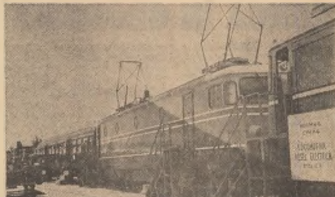
În 1981 transporturile de folosință îndelungată au fost dotate cu 129 locomotive Diesel și electrice, 2.993 vagoane de marfă în echivalent 4 oșii, autovehicule și remorci cu o capacitate de 56,3 mii tone, nave maritime cu o capacitate totală de 216.500 tdu. S-au dat în exploatare 340 km linii de cale ferată electrificată.