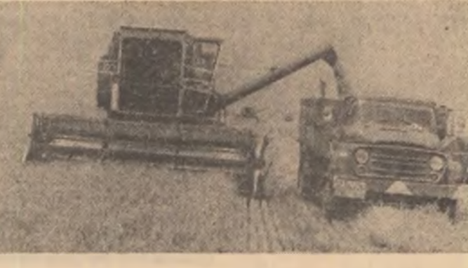
Relatări din județele CARAȘ-SEVERIN și CONSTANȚA în pagina a IV-a

Intr-o serie de județe din sudul țării a început recoltarea grîului. În județele din partea de nord a țării, se desfășoară din plin secerișul orzului. Ne aflăm, deci, într-o perioadă decisivă privind succesul actualii campanii agricole, cînd toate lucrările trebuie să se desfășoare într-un ritm tot mai intens. Formațiile de combine trebuie imediat dirijate în lanurile cu orz sau grîu, avîndu-se în atenție faptul că temperaturile ridicate determină maturarea rapidă a spicelor. Declanșarea cu operativitate a acțiunilor în lanuri este în măsură să prevină pierderile de recoltă prin scuturarea, iar în următoarele 8-10 zile va trebui strîns și depozitat grîul de pe majoritatea suprafețelor cultivate în sudul țării.