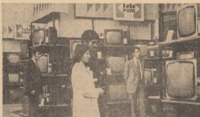
A crescut constant producția de bunuri industriale de folosință îndelungată destinate populației. Comparativ cu 1965, cînd se fabricau 323.000 aparate radio, 101.000 televizoare, 125.000 frigider, 75.000 mașini electrice de spălat, 50.592 aspiratoare, în 1980 s-au produs 863.000 aparate radio, 541.000 televizoare, 376.000 frigider, 344.000 mașini de spălat ruje, 145.000 aspiratoare.