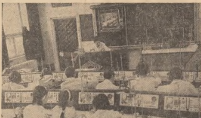
O importantă contribuție are industria la dezvoltarea bazei tehnico-materiale a învățămîntului, la mai deplină integrare a acestuia cu producția. Numai în acest an se vor da în folosință ale 6.000 noi locuri în atelierele școlare, numeroase laboratoare și săli de clasă, cele mai multe dintre acestea în licee de profil industrial și agrobiotehnic.