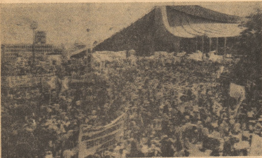
JAPONIA: Aspect de la o amplă demonstrație pe tru pace, împotriva cursei înarmărilor desfășurată recent la Tokio