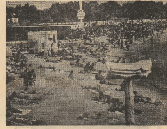
Costumești - zi bună pe litoral

TRAIAN T. COSOVEI (Continuare în pag. a III-a)