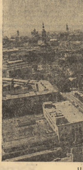
U.R.S.S.: Aspect din centrul orașului Tallin

STOCKHOLM 5 (Agerpres) — La Stockholm s-au încheiat lucrările Congresului Uniunii sindicale a funcționarilor din Suedia, organizație ce numără peste un milion de membri. O atenție deosebită în cadrul dezbaterilor a fost acordată problemelor internaționale, creșterii rolului sindicatelor în lupta pentru menținerea păcii. Documentele adoptate la încheierea lucrărilor subliniază că lupta pentru pace, pentru stabilirea cursei înarmărilor nucleare, pentru dezarmare este o cerință vitală a contemporaneității. O sarcină importantă în perioada actuală o constituie inițierea de negocieri între state în vederea creării de zone denucleezate în diferite regiuni ale lumii, pentru preîntîmpinarea unui război nuclear. Totodată, într-o declarație dată publicității, Congresul a condamnat agresiunea Israelului împotriva Libanului. În do-