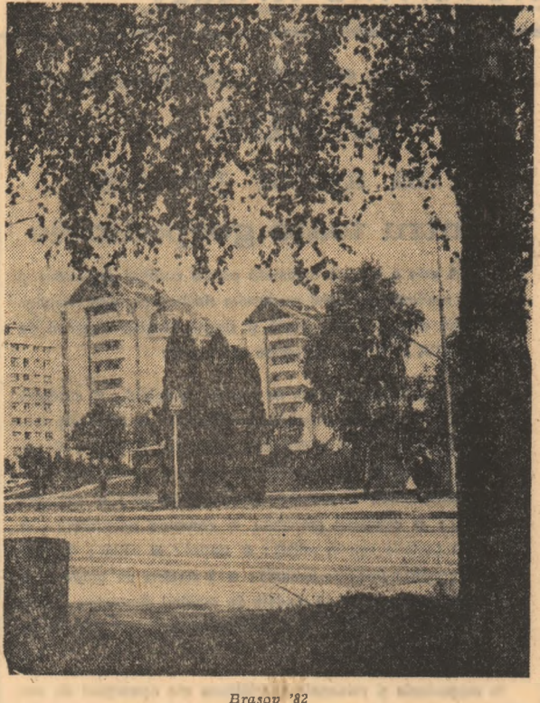
Brașov '82