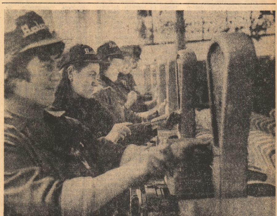
Întreprinderea „Balansa” — Sibiu

Cu maximă operativitate, cu întreaga capacitate de lucru