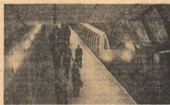
Metroul din București