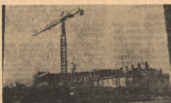
Platforma industrială Bistrița-Năsăud