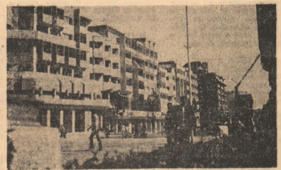
Centrul civic din Craiova