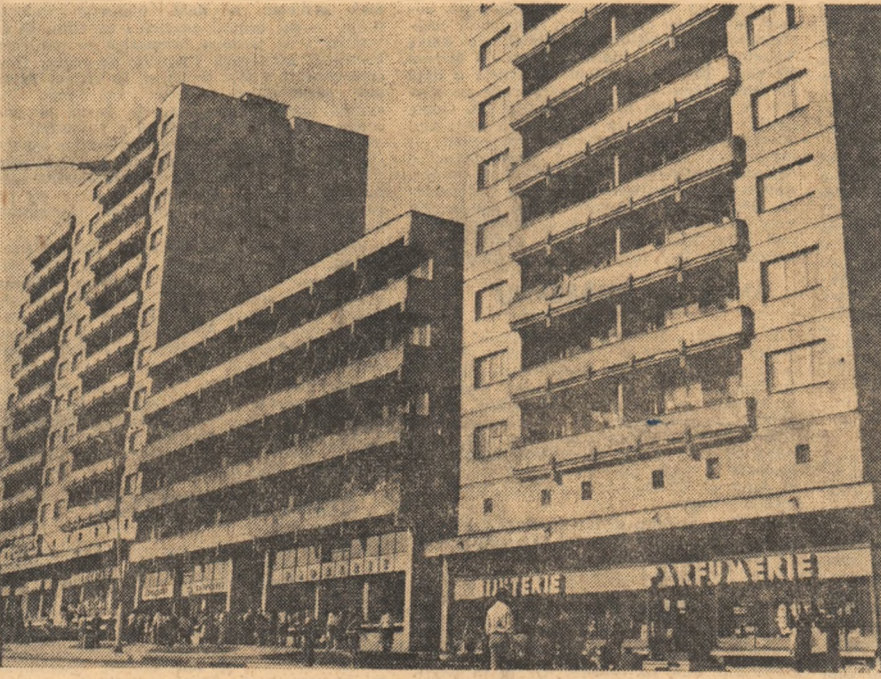
Imagine din Petrosani

Oamenii muncii din agricultura județului Constanța au încheiat recoltatul grîului. În telegrama adresată, cu acest prilej, Comitetului Central al Partidului Comunist Român, tovarășului NICOLAE CEAUȘESCU, de Comitetul județean Constanța al P.C.R., se spune: În prezenți, pe baza prețioaselor indicații și orientări pe care le-ați dat cu prilejul recentelor vizite de lucru în unitățile agricole din județul nostru, acționăm cu toate forțele pentru eliberarea terenurilor, realizarea programului de însămînțare a culturilor duble, stringerea și depozitarea furajelor, recoltarea și valorificarea superioară a legumelor și fructelor, presăritura și desfășurarea în bune condiții a lucrărilor agricole de toamnă. Vă asigurăm, mult stimat tovarășe secretar general, că vom acționa cu întreaga noastră putere de muncă pentru a împlini cea de-a XXV-a aniversare a cooperativizării agriculturii pe aceste meleaguri și sarcinile de plan îndeplinite, demonstrînd astfel superioritatea agriculturii socialiste, marile noastre posibilități de a îndeplini neabătut obiectivele noii revoluții agrare stabilite de cel de-al XII-lea Congres al Partidului Comunist Român.