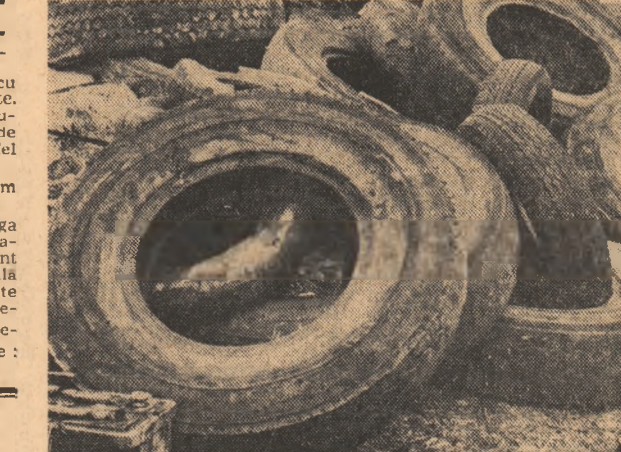
MASURILE FERME STOPEAZA „CARUSELULI DEROGARILOR NEJUSTIFICATE”