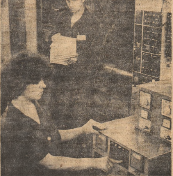
Activitate febrilă la Întreprinderea de mase plastice București