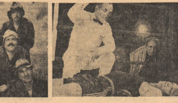
Un concurs pentru filmul Concurs ? Priviri interpretorilor par a căuta cit mai sus filmul lui Dan Pîta ...