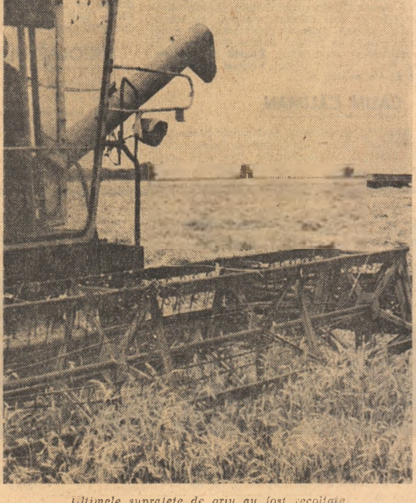
Ultimele suprafețe de grâu au fost recoltate