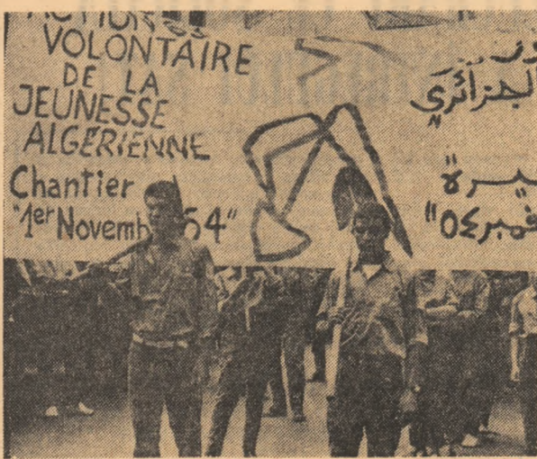
ALGERIA: Tineretul algerian ia parte activă la edificarea unor obiective economico-sociale de importanță națională.