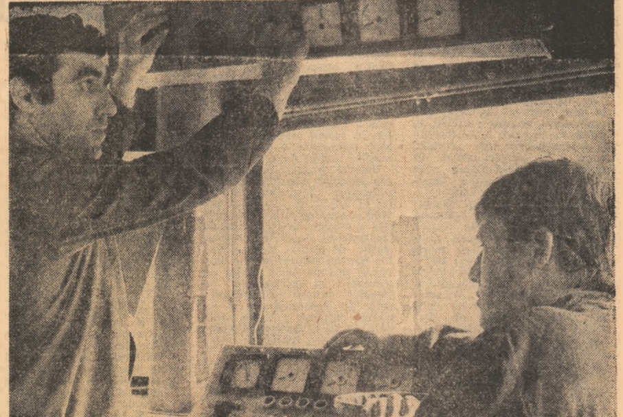
Noul mecanism economico-financiar