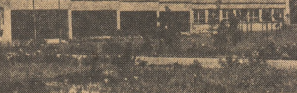
R.S. CEHOSLOVACĂ - Un nou liceu la Bratislava

mează agenția A.F.P. a transmis guvernului american, prin intermediul ambasadorului său la Tokio, o notă de protest în care își exprimă indignarea în legătură cu experiența nucleară americană de joii din Nevada și cere S.U.A. să renunțe la aceste experiențe și să se angajeze pe calea negocierilor în vederea lichidării totale a arsenalului nuclear. WASHINGTON 6 (Agerpres). - În apropiere de Casa Albă a avut loc o demonstrație anti-nucleară cu prilejul împlinirii la 37 de ani de la bombardamentul atomic de la Hiroșima și Nagasaki. Demonstranții purtau pancarte cu lozincile: „Nu - unor noi bombardamente atomice”, „Să închezeze cursa inarmărilor”.