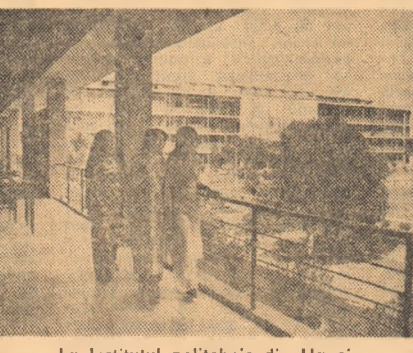
La Institutul politehnic din Hanoi