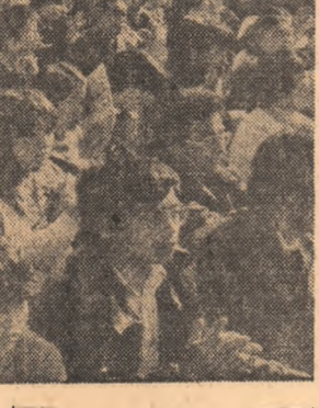
JAPONIA: Aspect de la imensitatea manifestațiilor pentru pace, împotriva înarmării nucleare etc. au avut loc recent în orașele Hiroșima și Nagasaki, victime ale primelor bombe atomice