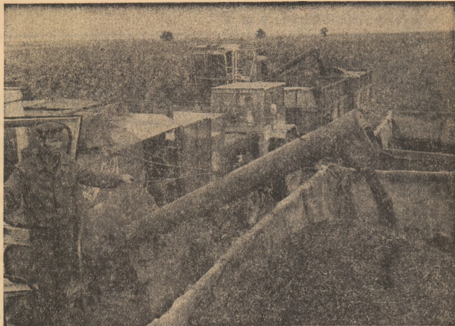
O nouă săptămână de muncă intensă în agricultură