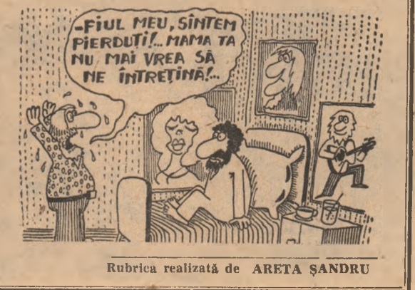
Rubrica realizată de ARETA ȘANDRU