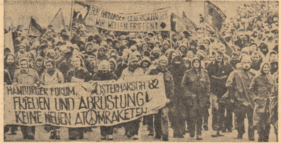
R. F. GERMANIA - Demonstrație în favoarea pacii, împotriva cursei înarmărilor, desfășurată la Hamburg