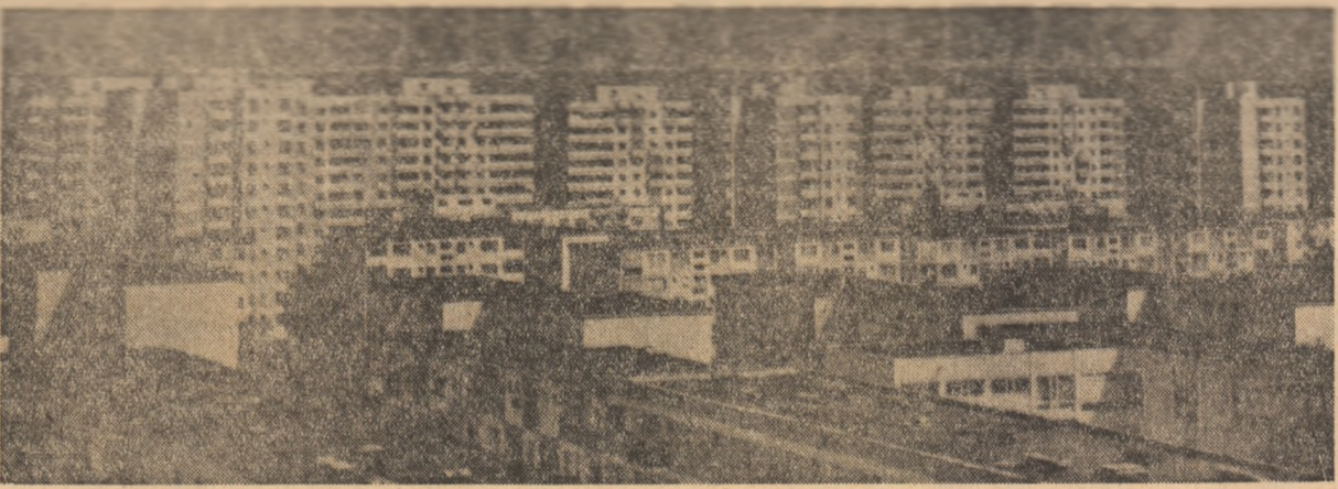
Suceava anului 1962