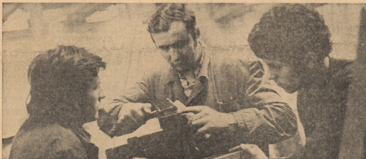
Secţia de autoutilitare a Întreprinderii „Tractorul” din Braşov