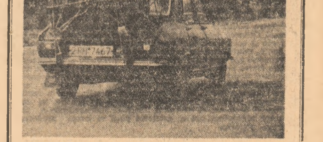
La drum, pe o șosea din Topoteni, cu număr de Prahova și cu vîn de Segarcea

ORIZONTAL: 1) Ieri copil, mine tînar 2) Tînarul de caracter — Iși ninge floarea peste creștele îndrăgostitor. 3) Oțelul pieptului — Chemarea departării — Din cînd în cînd, 10) Tinerii participanți la „Daclada”.