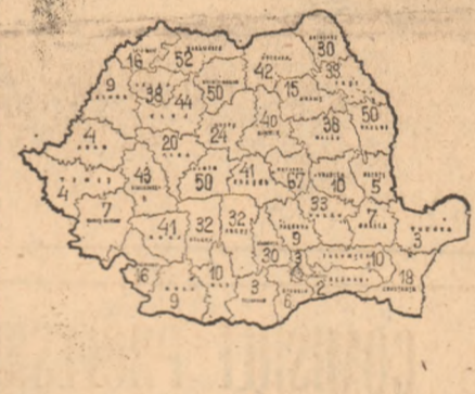
Stadiul însămînțării la grîu-seară (în procente, la data de 30 septembrie 1982)