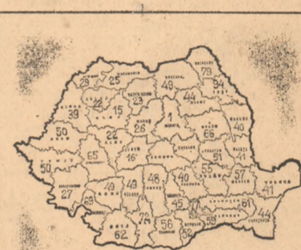
Stadiul recoltării porumbului (în procente, la data de 30 septembrie 1982)

● GRÎUL, realizat pe numai 19 la sută din suprafețele planificate, solicită de urgență mobilizare mai intensă de forțe pentru a nu depăși, sub nici un motiv, epoca optimă.