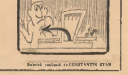
Redacția (redacția de CONSTANTIN ETAN)

Apel. În cadrul sesiunii plenare a Comitetului mondial al tineretului, vor avea loc sesiunile de lucru ale Comitetului mondial al tineretului.