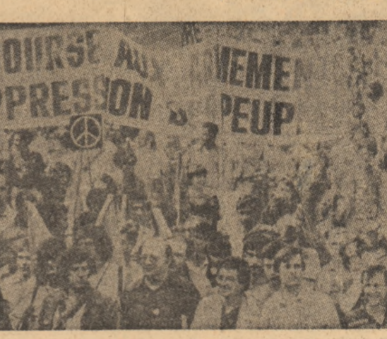
Imagine de la o mare demonstrație desfășurată la Paris împotriva continuării cursei înarmărilor