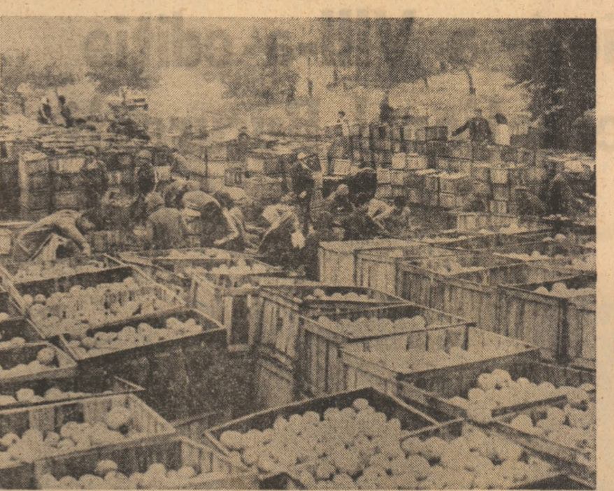
au recoltat pînă la începutul lui octombrie peste 30 tone prune în valoare de 6.000 lei, aproape 500 tone mere în valoare de 10.000 lei, ne confirmă șeful fermei, Dumitru Istrate.

Agenda agriculturii dia județul BOTOSANI cuprinde în aceste zile proiecte ce se cer grabnic realizate. Tocmai de aceea importante forțe se alătură opritelor în vederea însămînțării grâului Vrem ca în zilele următoare să terminăm lucrările pe celelalte 160 ha pentru a ne concentra apoi la recoltarea sfeclii de zahăr.