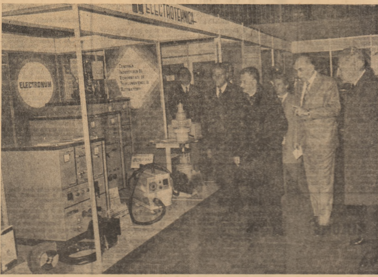
Linia Ceaușescu a recomandat ca industria noastră să acorde mai multă atenție folosirii modelelor naționale realizate din principalele zone folclorice ale țării.

Au fost unanim apreciate motoarele electrice monofazate, liniare, rotative, precum și micromotoarele specializate fabricate pentru prima oară în țara noastră. De asemenea, a reținut atenția gamă largă a bunurilor electrice de uz casnic, care evidențiază preocuparea industriei de a satisface într-o tot mai mare măsură cerințele populației. Tovarășul Nicolae Ceaușescu a avut cuvînte de apreciere la adresa realizărilor constructorilor de mașini-unelte, de aparatură electrotehnică și electronică și a indicat să fie dezvoltate capacitățile productive care re-