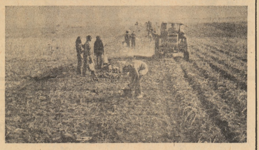
„Elevii sînt pe cîmp...”