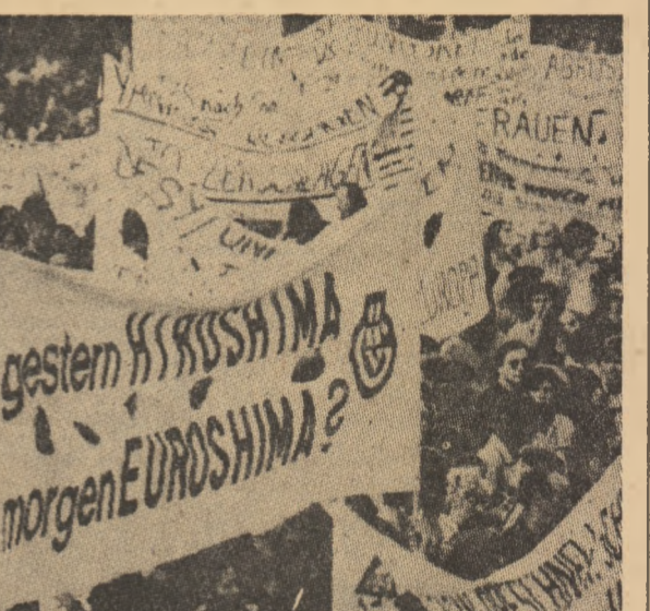
R. F. GERMANIA: Aspect de la una din marile demonstrații ale populației împotriva înarmării și „aurochelor”