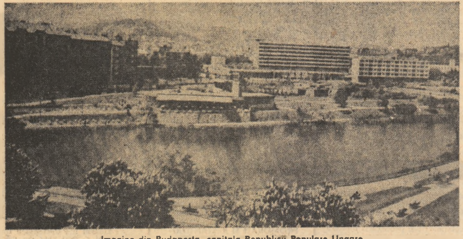
Imagine din Budapesta, capitala Republicii Populare Ungare

OTTAWA 18 (Agerpres) — În orașul canadian Toronto a avut loc o demonstrație de masă desfășurată sub lozincă luptei împotriva înarmărilor nucleare, împotriva atragerii Canadei la acțiunile de experimentare a rachetelor de croazieră. Participanții purtau pancarte cu inscripții ca: „Nu! experimentării rachetelor de croazieră în Canada!”, „Canada trebuie să devină o zonă de nuclearizată!”.