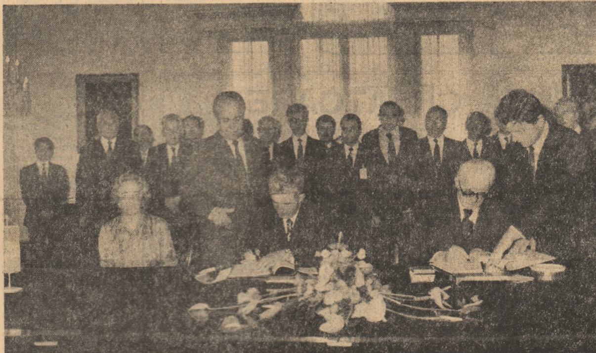
Secretarul general al Partidului Comunist Român, Nicolae Ceaușescu și președintele Republicii Socialiste România, Petar Stambolici, au semnat Declarația comună româno-iugoslavă. În fața lor stau tovarășii...

Miercuri, 27 octombrie 1982, tovarășul Nicolae Ceaușescu, secretar general al Partidului Comunist Român, președintele Republicii Socialiste România, și tovarășul Petar Stambolici, președintele Prezidiului Republicii Socialiste Federative Iugoslavia, au semnat, în cadrul unei solemnități desfășurate la Palatul Alb, Declarația comună româno-iugoslavă. Ceremonia semnării s-a desfășurat în prezența tovarășei Elena Ceaușescu.