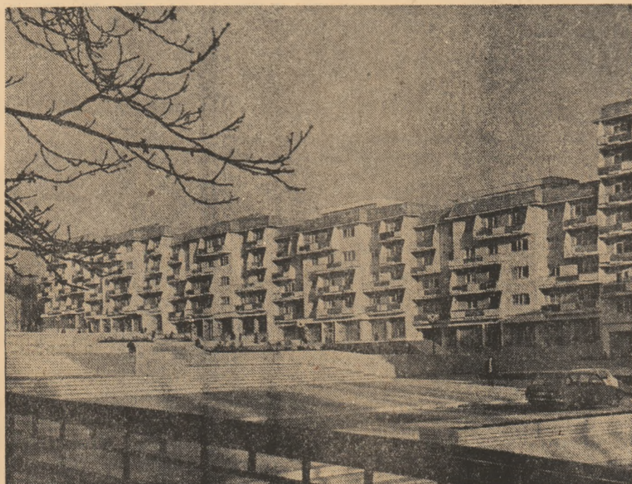
Arhitectură nouă în orașul Sîntu Gheorghe

Carnet electoral: TINERETEA ÎN HAINE DE LUCRU • Evenimente în viața organizațiilor U.T.C. — adunările și conferințele de dare de seamă și alegeri • CONTINUARE FIREASCĂ A MUNCII DE PINĂ ACUM • Priorități pe ogoare: EFORTURI SUSȚINUTE PENTRU ÎNCHIEIEREA ARĂTURILOR; SEMNAL • Măsuri și acțiuni eficiente pentru buna aprovizionare a populației: DEPOZITUL — CĂMARA CEA MAI SIGURĂ A GOSPODINELOR!