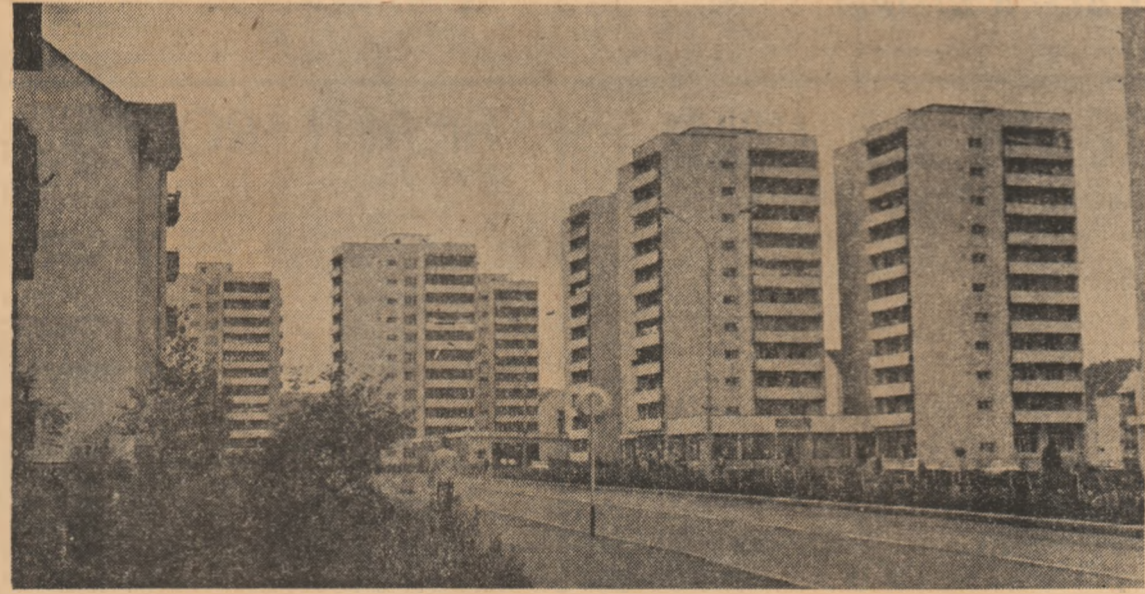
Innoiri urbanistice la Miercurea Ciuc.