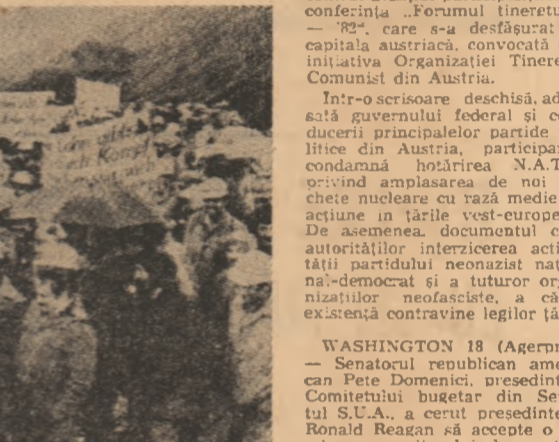
Imaginile din timpul unei ample demonstrații a siderurgistilor din Hamburg, R.F. Germania, împotriva creșterii alarmante a șomajului