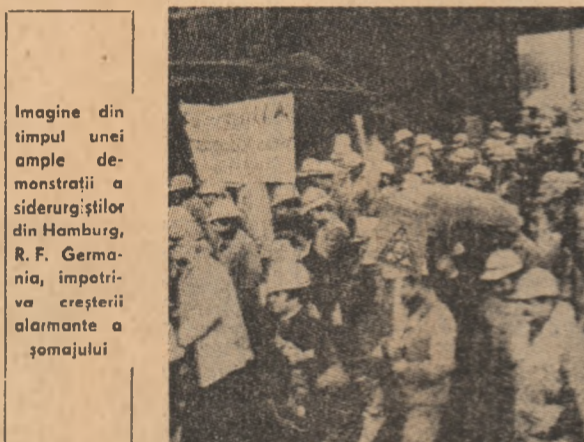
Imagine din timpul unei ample demonstrații a siderurgistilor din Hamburg, R.F. Germania, împotriva creșterii alarmante a șomajului