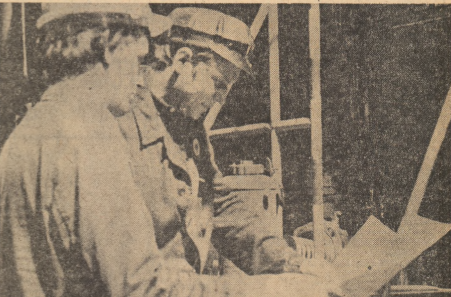
La I.M.M.R. Reștia transferul de experiență se face cu răspunderea pe care o impune înalta competență profesională a acestui colectiv

Președintele Republicii Socialiste România, tovarășul Nicolae Ceaușescu, a primit, ieri, pe ambasadorul Republicii Democratice și Populare, Chadli Bendjedid. În continuare, președintele Nicolae Ceaușescu și ambasadorul Republicii Algeriene Democratice și Populare au prezentat scurte cuvintări.