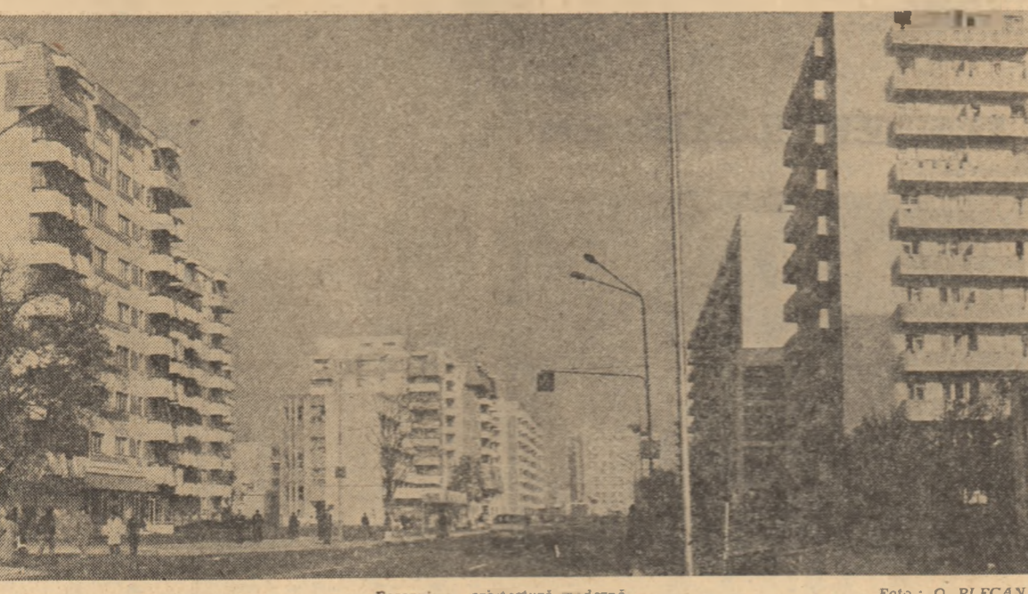
Focșani — arhitectură modernă

La poporul nostru, frații și colaborării fructuoase dintre oamenii muncii români și cei aparținând naționalităților conlocuitoare. Desigur, știe de principii democratice nu lipsesc din panoplia ideologică ale țărilor capitaliste, din legislația acestor state.