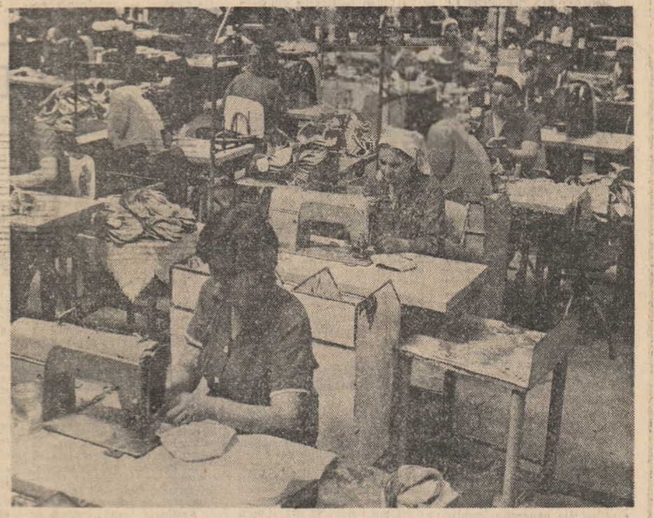
Hărnicie, dăruire, competență — atribute ce caracterizează tînrul colectiv muncitoresc de la uzina de reparatii de tîmp și încălzîmînt din cauciac din Drăgășani — Vîlcov.

te”, valoarea producției realizate ridicîndu-se la peste 350.000 lei, concretizată în montaj tractoroare și autocomioane, aparate electrice, echipament electric auto și tractor etc. NEAMȚ: Tot într-o săptămînă record de producție, cei 8.300 de tineri din acest județ, care au rîsuns inițiativei, au realizat suplimentar, printre altele produse: 60 tone îngrășăminte chimice, 15 semănători, 5 tone fibre melană, 800 tone țesut, 1.000 bucăți tricotate. OLT: La rîndul lor, utecistii din principalele unități economice din acest județ au realizat săptămîna