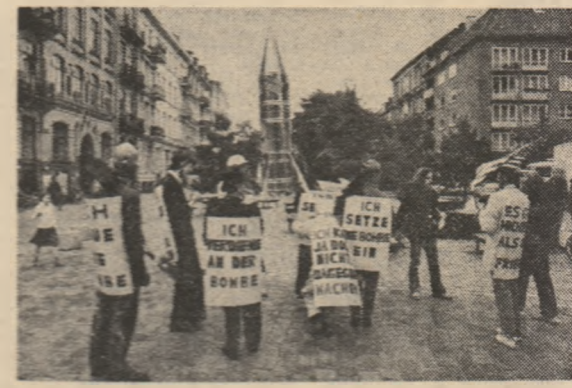
„Ich sage: Wehrt Euch!“, scrie „Der Spiegel“. Adică, „Ei spun: Apărati-vă!” Un patetic apel, lansat în cursul unei insolite manifestări desfășurate în orașul vest-german Hamburg, împotriva pericolului pe care-l reprezintă armele moderne pentru fiecare om, pentru întreaga omenire.