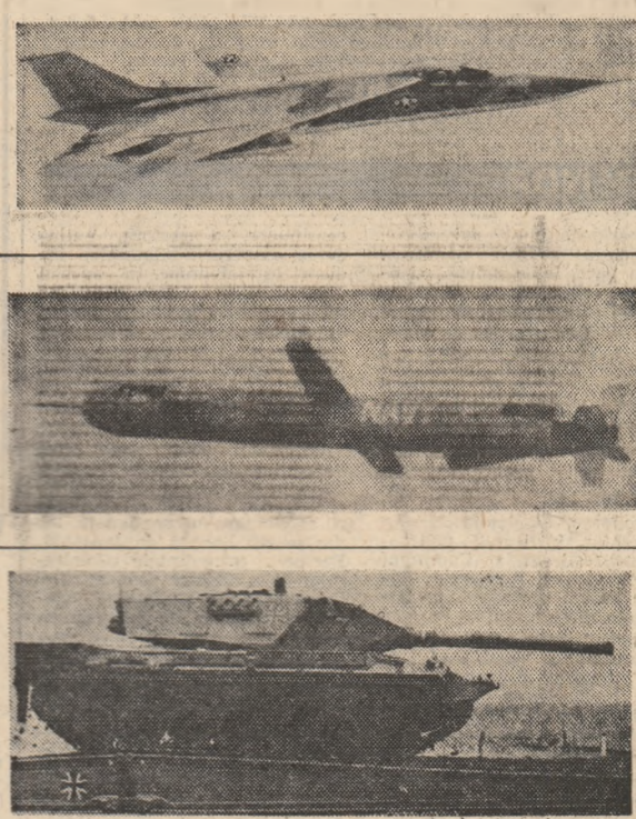
Citeva din rezelele noilor „generații” de arme, rod al unor cercetări care valorifică la un mod cit se poate de impropriu cunoștințele științifice, fabricînd unelte ale morții!