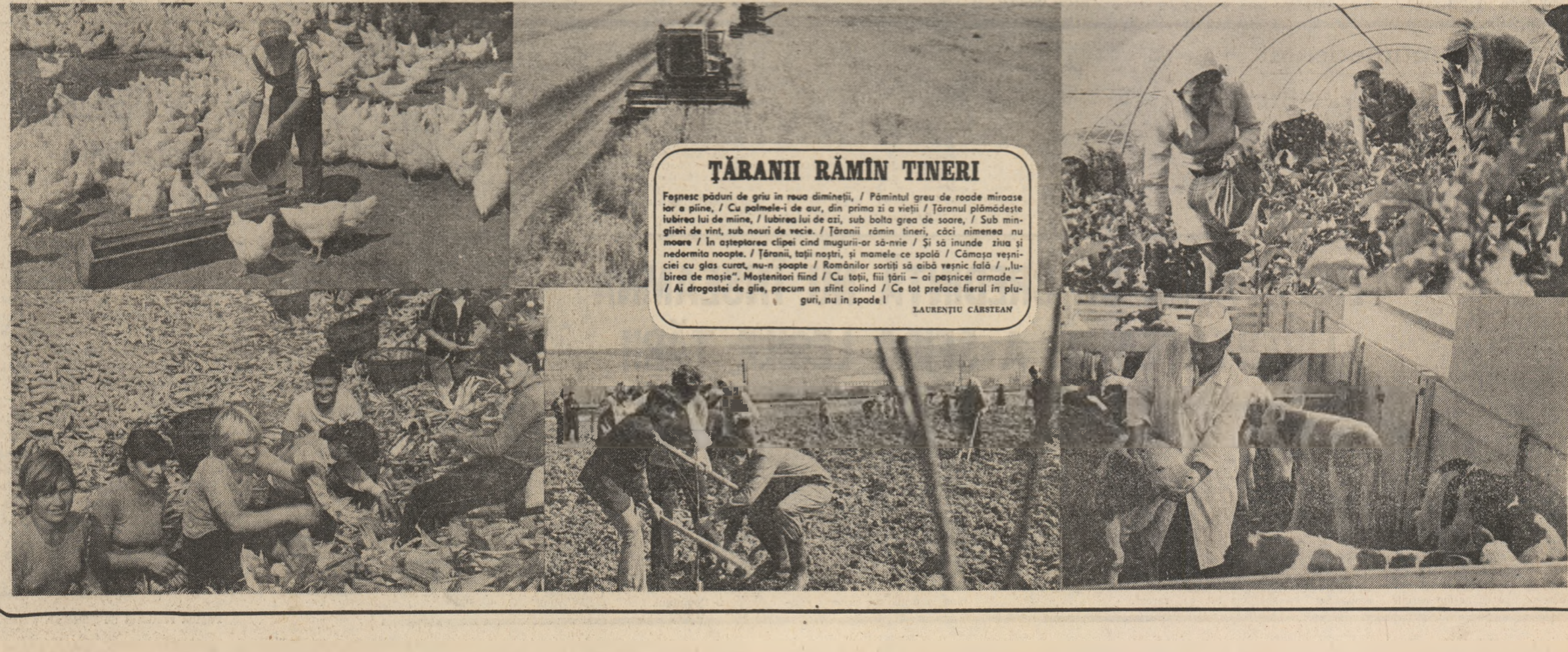
TĂRANII RĂMÎN TINERI Făcuse păduri de griu în roșu dimineții...

Pagină realizată de LAURENȚIU OLAN și GABRIEL NĂSTASE