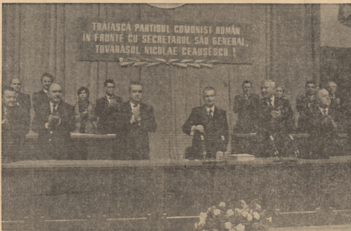
TRAIASCA PARTIDULUI COMUNIST ROMÂN ÎN FRUNTE CU SECRETARUL SAU GENERAL, TOVARAȘUL NICOLAE CEAUȘESCU!

Îngăduiți-mi, mult stimată tovarășe secretar general, să vă exprim, în numele participanților la plenară, al tuturor celor ce muncesc în agricultură, industrie alimentară, silvicultură și gospodărire a apelor, cele mai alese sentimente de dragoste și profundă recunoștință pentru activitatea de înaltă competență și nemărginit devotament cu care conduceți destinația patriei și poporului nostru, în înaintarea