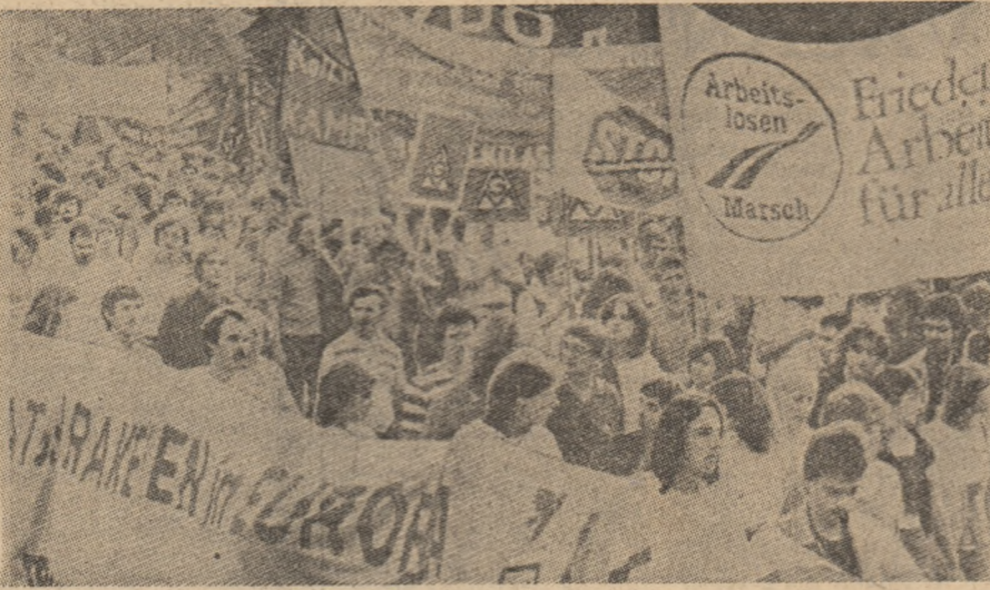
Arbeitslosen Marsch. Enecești în orașul Frankfurt pe Main împotriva creșterii înarmării și asigurării dreptului lor la muncă.

ÎN LEGATURĂ CU REDUCEREA alocațiilor pentru învățămînt, ministrul de resort din Danemarca va procedea la ample negocieri de cadre didactice. Potrivit ziarului „Berlingske Tidende” în 1983 vor fi concediate 660 cadre didactice și vor fi reduse fondurile pentru construirea de școli. În prezent, numărul de cadre didactice din Danemarca care nu au de lucru este de peste 2.000.