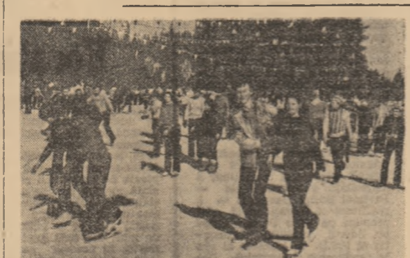
Tot mai sperăm că rine... zăpada!