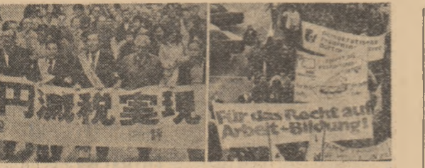
Demonstrații de protest ale oamenilor muncii din Japonia și R. F. Germania, împotriva creșterii șomajului

Perspectivile ieșirii din depresiune sint foarte incerte, ele depinzînd, în continuare, de dezvoltarea multor factori. În primul rînd, de cererea de consum. Dar menținerea la un nivel înalt a șomajului și a unui ritm și mai înalt al inflației în cele mai multe state occidentale, intensificarea ofensivii împotriva nivelului de trai al oamenilor muncii, sporierea deficitelor bugetare atînt în S.U.A. cît și în alte țări membre ale N.A.T.O., agravată de creșterea considerabilă a cheltuielilor militare, sint tot altele motive care îndreptățesc concluzia că cererea de consum nu va spori în nici un fel. „Nu am putea face față încă un an ca 1982”, scrie „Wall Street Journal”. Pesimismul ce se degajă din încercările de prefugare a anului 1983 nu lasă însă impresia că ar surveni o ameliorare a situației.