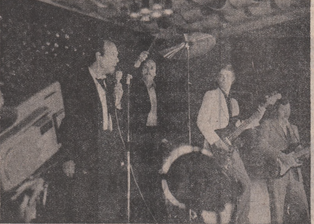
„Roșu și Negru” se prezintă singură. Nici nu mai trebuia...