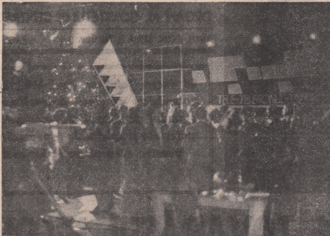
Un Revelion al tineretului nu poate începe decît eu... DANS

Pagina de față se vrea, într-un anumit fel, o reeditare a Revelionului tineretului, o trecere de la limbajul direct și expresiv al imaginii la acela al cuvintelor, abstracte, adesea concentrînd sensuri din domeniul sensibil al artistului. Deci, încă o dată REVELIONUL TINERETULUI!