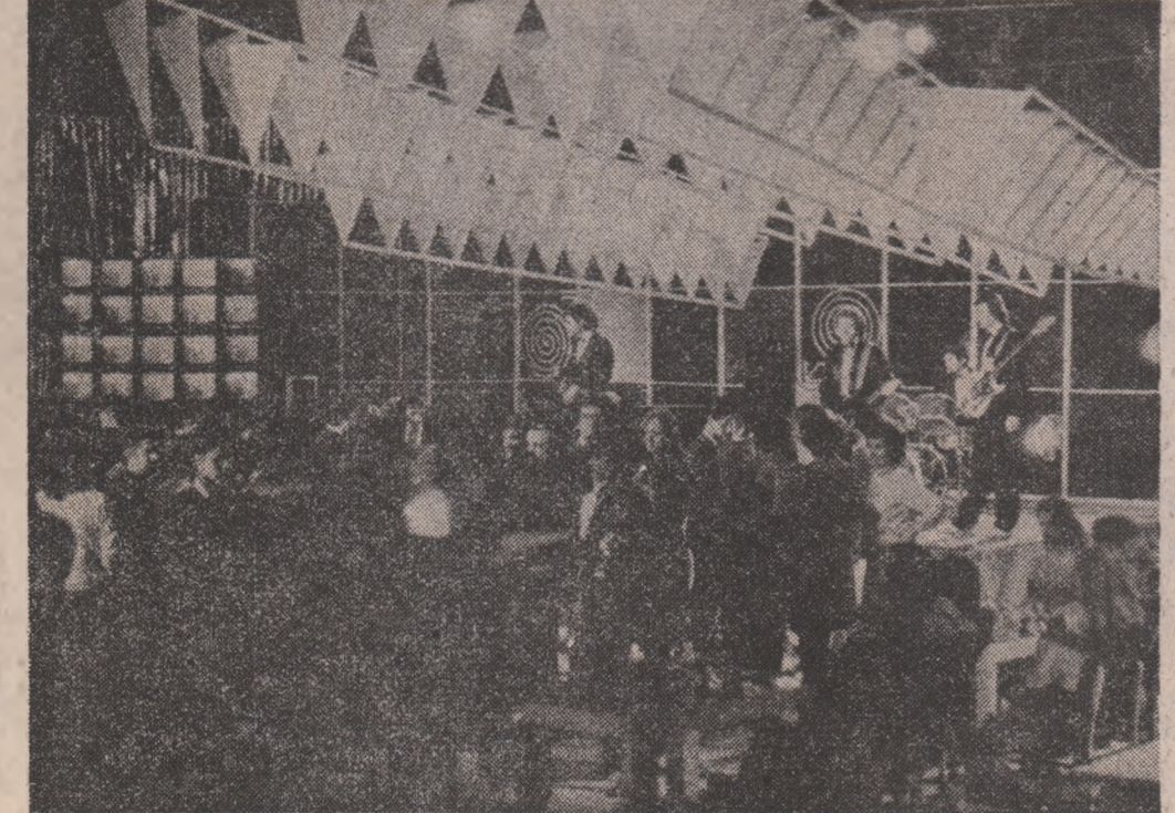
Nicăieri nu poate fi mai bine decît la Revelionul tineretului Priviți cu atenție încă o dată spre a vă convinge