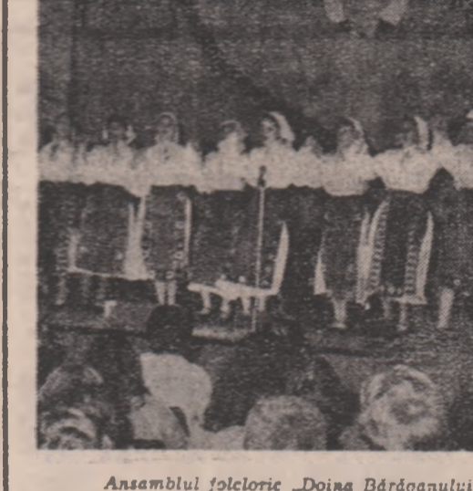
Ansamblul folcloric „Doina Bărănaului” din Slobozia