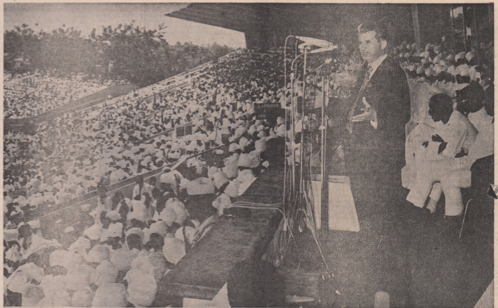
Pe toate continentele globului mesajul profund umanist de pace, colaborare și progres al României socialiste a fost purtat cu strălucire de tovarășul Nicolae Ceaușescu, personalitate prestigioasă a lumii contemporane

Pentru că omul, umanitatea au un drept imprescriptibil la care nimic și nimeni nu trebuie să atenteze — dreptul la viitor.