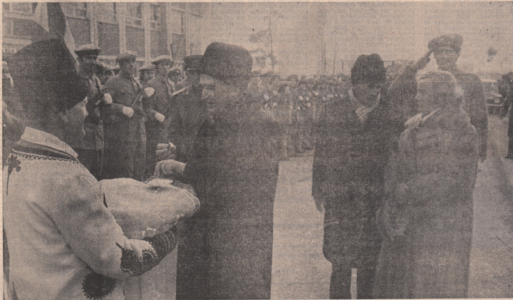
Primire entuziastă făcută fiului iubit al comunei și al țării

Joi, 27 ianuarie, tovarășul Nicolae Ceaușescu, secretar general al Partidului Comunist Român, președintele Republicii Socialiste România, împreună cu tovarășa Elena Ceaușescu, au fost oaspeții comunei Scornicești, localitate natală a conducătorului partidului și statului nostru.