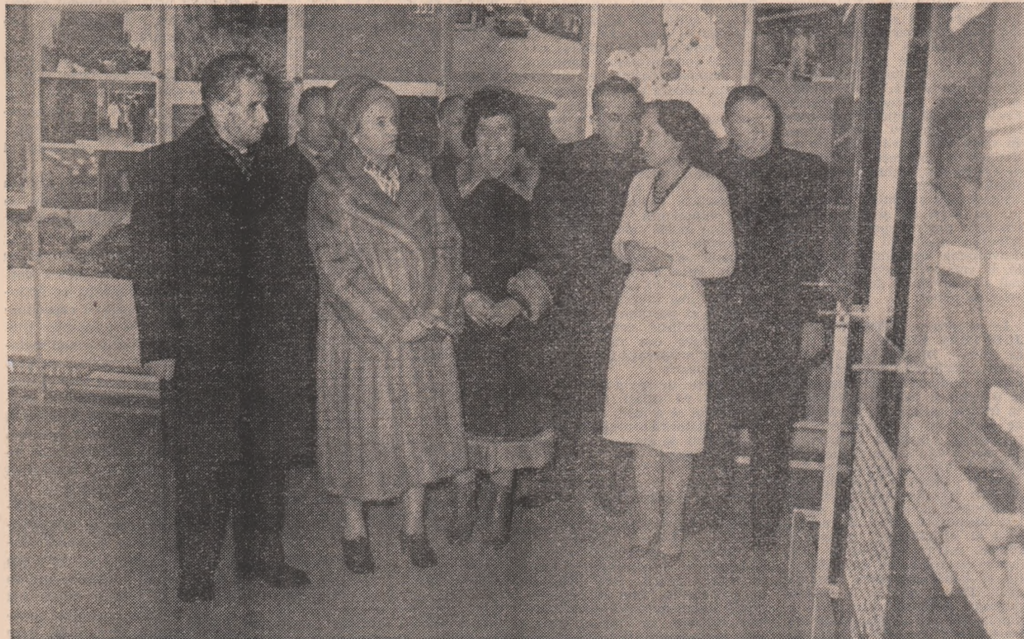
La muzeul de istorie al comunei