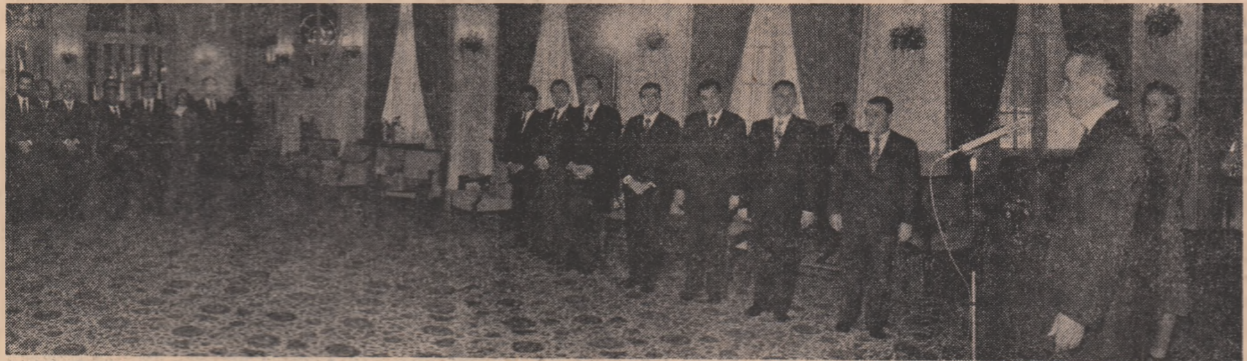
(Urmare din pag. 1) tovarasese academienele doctor inginer Elena Ceausescu un exemplar din recenta versiune italiana a lucrării sale „Noi cercetari in domeniul compusilor macro-moleculari”.

„Mulumind pentru felicitările si urările ce i-au fost adresate, Nicolae Ceausescu a rostit o cuvintare urmarita cu deosebit interes si simpatie de vizi „plauze de cei prezenti”.