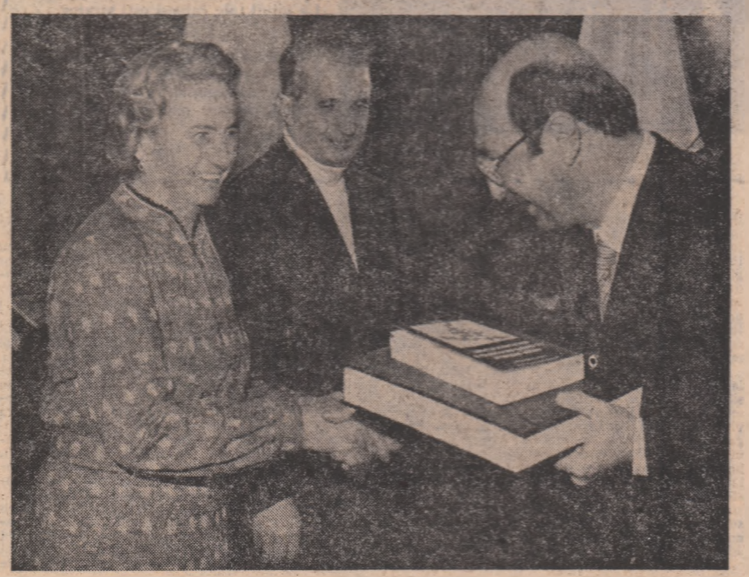
(Continuare în pag. a III-a)