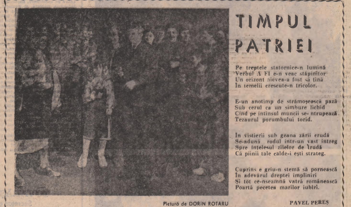
Pictură de DORIN ROTARU

Pe treptele statornice-n lumină Verbul A FI e-n veac stăpînor Un orizont aievea-a fost și lina În temelii crescute-n tricolor.