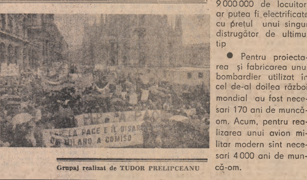
Grupaj realizat de TUDOR PRELIPCEANU

Din fiecare dolar alocat în scopuri militare, 42 de cenți sînt asigurați pe seama restrîngerii consumului individual, 39 de cenți pe seama investițiilor în mijloace fixe (mașini, utilaje, construcții etc.) iar restul pînă la 100 de cenți prin reducerea importurilor și exporturilor, precum și a cheltuielilor administrative de stat. Pentru țările în curs de dezvoltare, fiecare dolar cheltuit pentru înarmări înseamnă scăderea investițiilor în economie cu circa 25 de cenți.