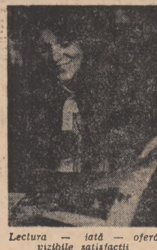
Lectura — iată — oferă vizibile satisfacții