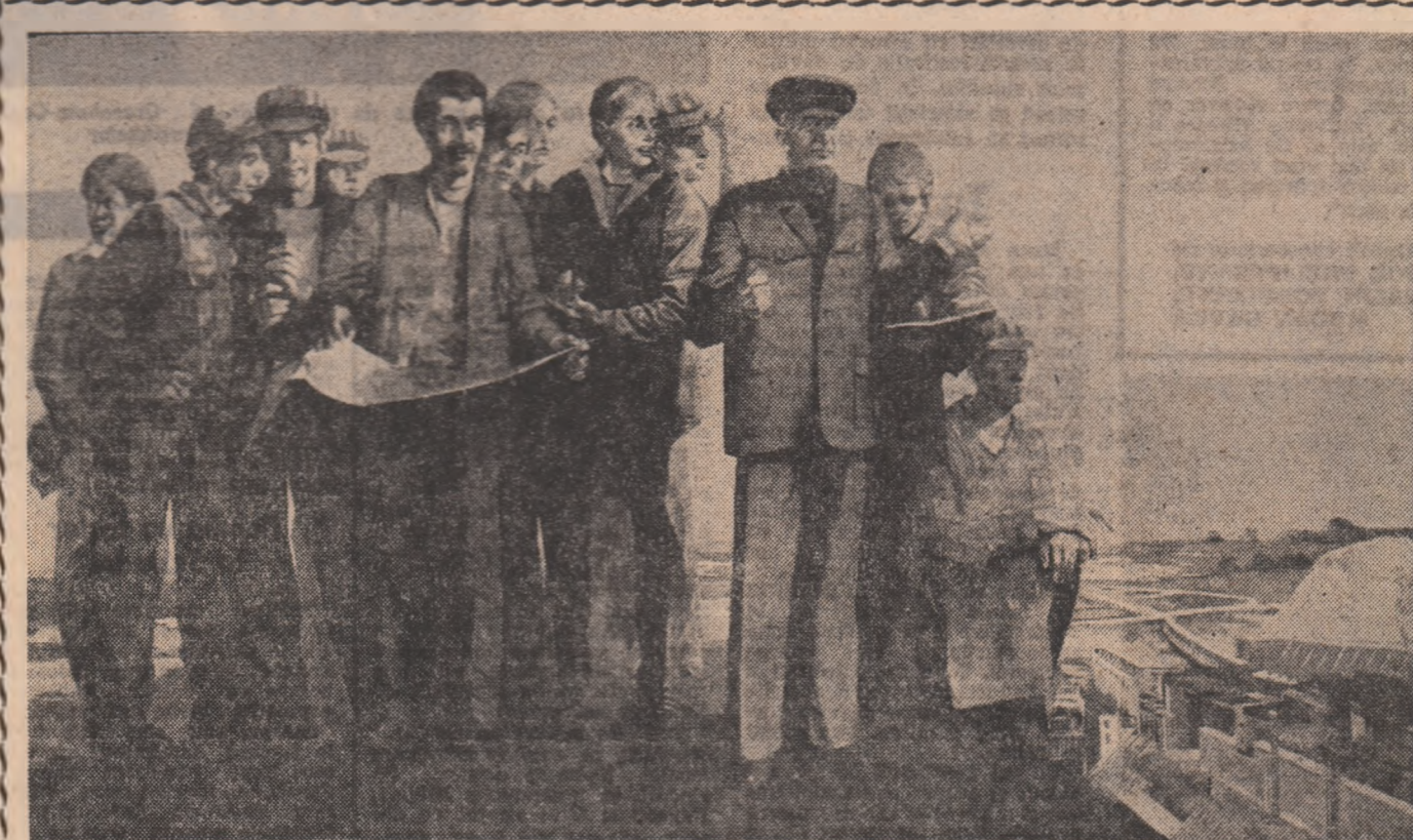
Vizită de lucru la Canalul Dunăre - Marea Neagră

„Mult iubite și stimatelor tovarășe Nicolae Ceaușescu, în aceste momente de emoționantă sărbătoare pentru întreaga noastră națiune socialistă, ÎNTEG PERSONALUL FILIALEI CLUJ-NAPOCA A ACADEMIEI R.S. ROMÂNIA, membri titulari și corespondenți, cercetători și bibliotecari, personal administrativ și muncitori vă roagă să fiți încredințat de profundele lor sentimente de stimă, dragoste și respect cu prilejul celor 50 de ani de activitate revoluționară și a zilei dumneavoastră de naștere.