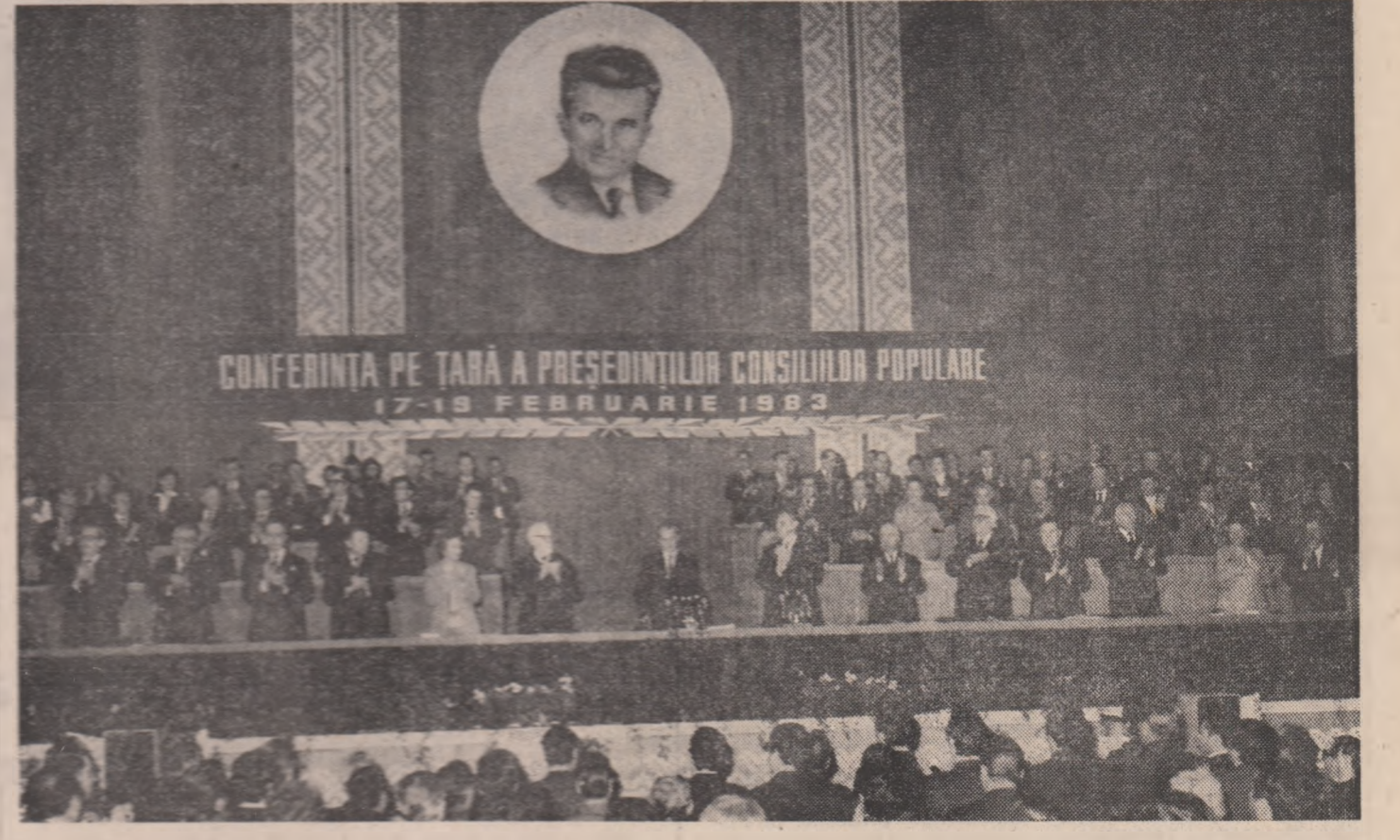
În prezența tovarășului Nicolae Ceaușescu, secretar general al Partidului Comunist Român, președintele Republicii Socialiste România, joi, 17 februarie, s-au deschis la București lucrările Conferinței pe țară a președinților consiliilor populare, eveniment de seamă în viața politică a patriei noastre.

Intrunirea acestui larg și reprezentativ forum, instituționalizat din inițiativa tovarășului Nicolae Ceaușescu, se înscrie ca un nou și semnificativ moment în amplul proces de adâncire a democrației socialiste în România, relevând rolul important ce revine consiliilor populare — puternică forță politică și organizatorică în structura statului nostru — în asigurarea participării efective a tuturor cetățenilor, fără deosebire de naționalitate, la conducerea întregii activități economice și sociale din județe, orașe și comune, în mobilizarea maselor la îndeplinirea misiunii și obiectivelor de dezvoltare stabilite de Congresul al XII-lea și Conferința Națională ale partidului, a întregii activități de edificare a socialismului și de realizare a progresului național.